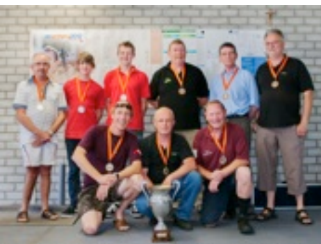
1 augustus: Olympisch Hyundai toernooi voor de thuisblijvers: goud voor Krijgsman Soranus, zilver voor Ontspanning en brons voor de Bosjagers