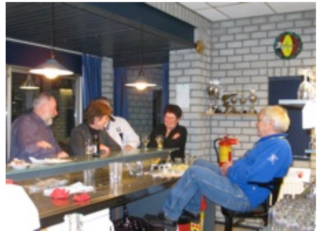
7 april: Deskundige evaluatie van de scores