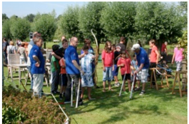
5 augustus: Jaarlijks oogstfeest van de Zandhoef. Aan belangstelling van de jeugd hadden we geen gebrek